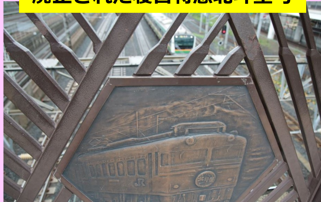
廃止された寝台特急北斗星号